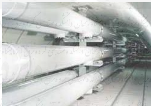
شکل ۳-۱: خط انتقال Shinmeika-Tokai

۲۸۵۰ مگاوات بطول ۳/۳ کیلو متر احداث گردید که در شکل ۳ نشان داده شده است.